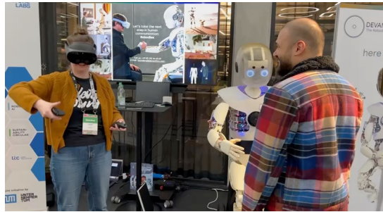
Erstnutzer – sicher nach 2'