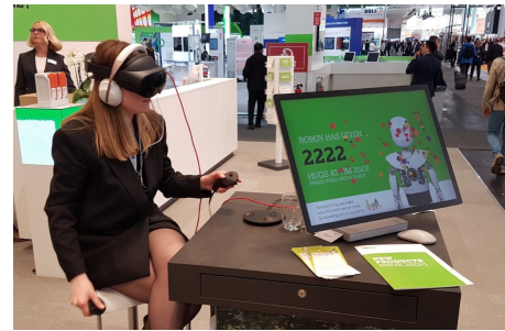
2k+ Robody Umarmungen