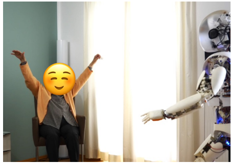
Pflegeresidenz "Alte Post", Seeshaupt

durch Pflegebedürftige, Pflegekräfte, Angehörige und alle anderen